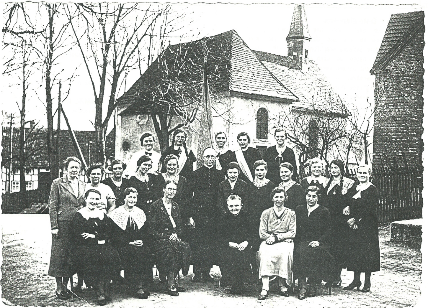
Wer erkennt sich wieder ? Die Frauengemeinschaft Himmighausen um 1935