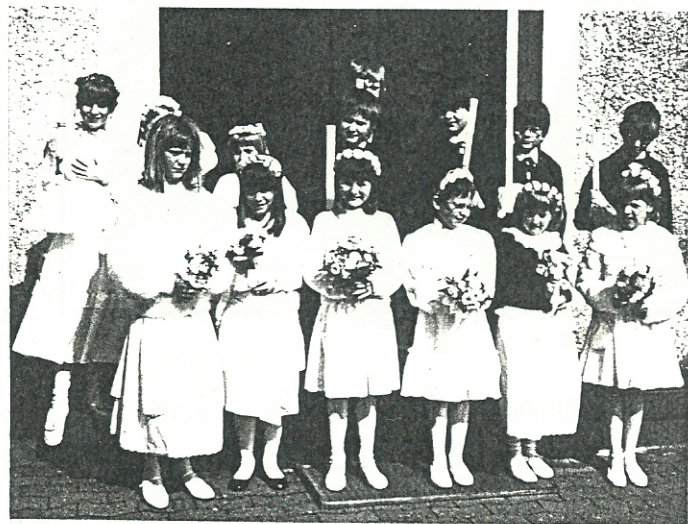
Die Kommunionkinder 1988 mit ihren Engelchen

Für die vielen Glück- und Segenswünsche, für Geschenke und Aufmerksamkeiten anlässlich dieses hohen Festes bedanken sich die Kommunionkinder an dieser Stelle recht herzlich bei allen Gratulanten.