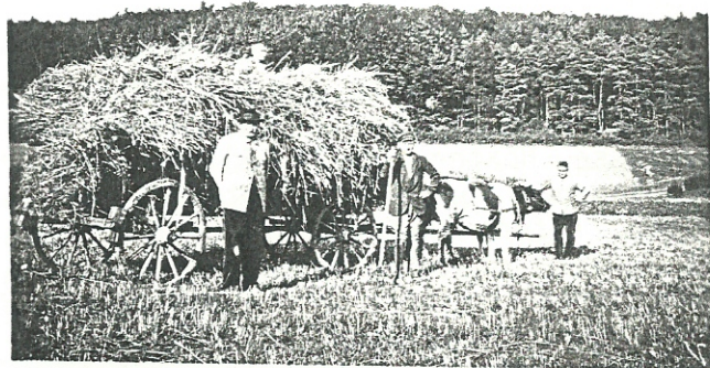
Landwirtschaft in den 50er JAHREN mit Kuhgespann